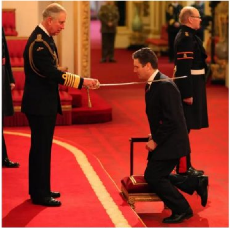
ستامەر له سالی ۲۰۱۴ نازنای سیزی وەرگرت