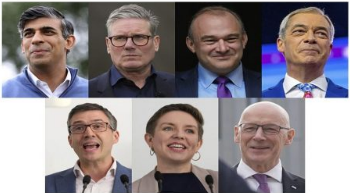
سەرۆكى حزبە جياوازەكان لە ھەلبژاردنى كشتىي برىتانىا

۶- حزبى سەوز (Green Party of England and Wales) كە خاتوو كارلا دىنيەر (Carla Denyer) و ئادريان رامسى (Adrian Ramsay) بەھاوبەشى سەرۆكايهتتى دەكەن. ئەم حزبە لە ھەلبژاردنەكانى پېشوو ۱ كورسىيە بەدەست ھېنابوو.