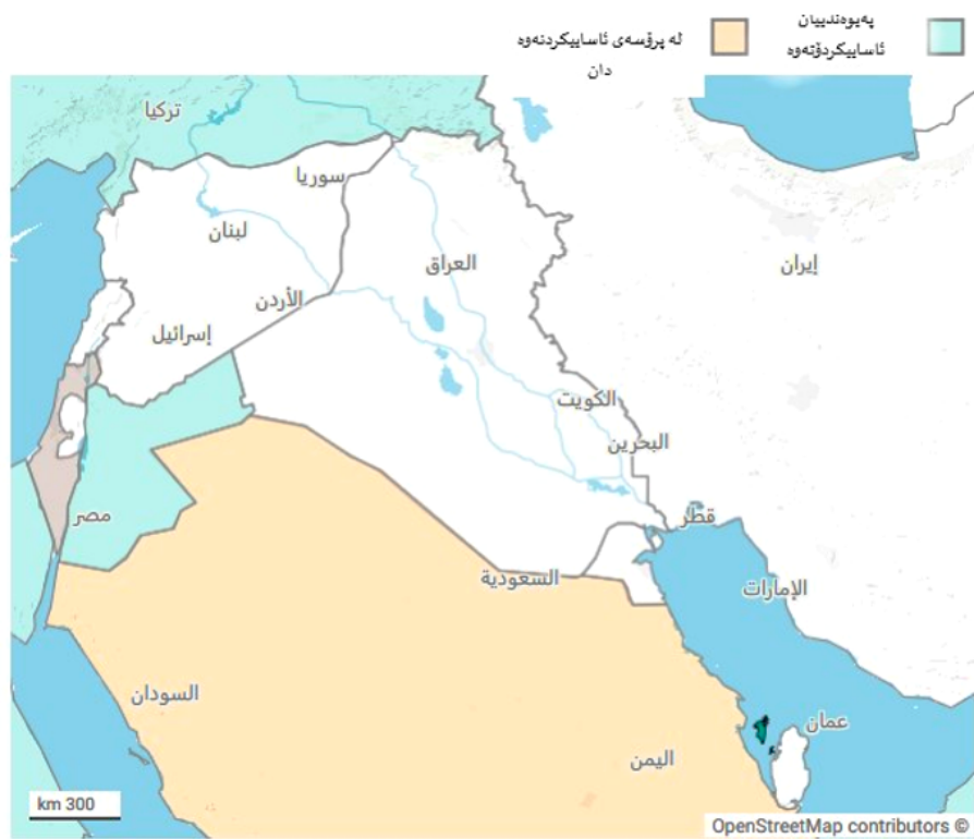
خریطة: أمواج. میدیا • Created with Datawrapper