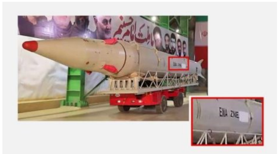
ژماره‌ی زنجیره‌یی له‌سه‌ر وێنه‌ی فه‌رمیی مووشه‌کی عیما‌د

هه‌روه‌ها له وێنه‌یه‌کدا که له توپری کۆمه‌لایه‌تی ئیکس (“تویته‌ر” ی پیشوو) بلاو کرایه‌وه، پارچه‌یه‌ک که له ئوردن خراوه‌ته سه‌ر زه‌وی، ژماره‌یه‌کی زنجیره‌یی له‌سه‌ر په‌رپه‌یه‌کی کانزای ده‌بینرێت.