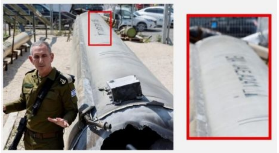
ژماره‌ی زنجیره‌یی له‌سه‌ر پاشماوه‌ی ئەو مووشه‌که بالیستییه‌ی که سوپای ئیسرائیل دوو پوژ دوای ئۆپه‌راسیۆنی ئێران پیشانی دا