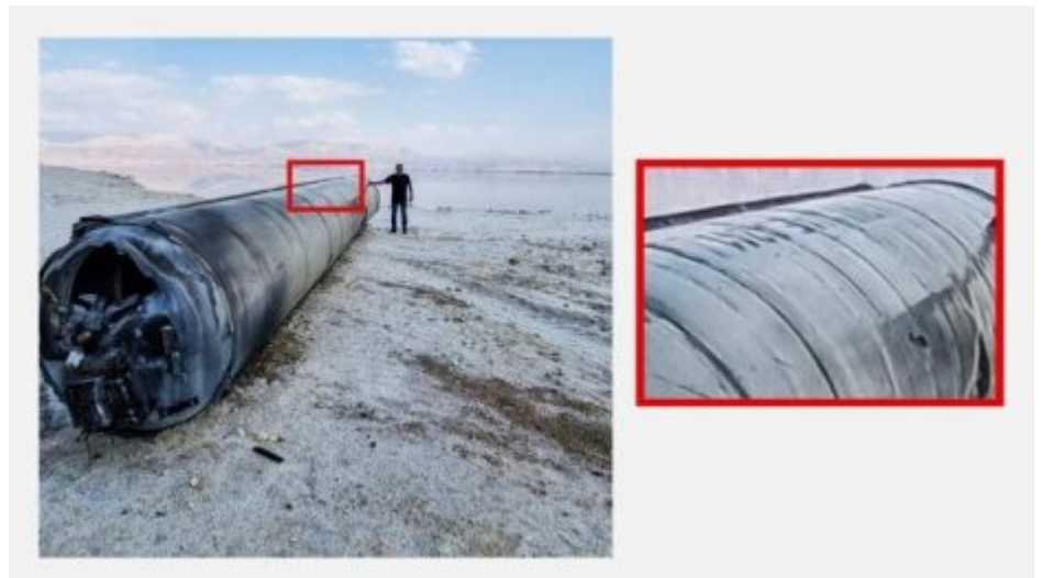
ژمارەى زنجىرەيى لەسەر لاشەى موشەكە كە لە كەنارى “دەريای مردوو”

ئەو وینانەى كە میدياكانى ئىران لە تەقاندنى ئەو چەكانە بەرھو ئىسرائىل بۆلۈيان كرووتەوھ، لەگەل پاشماوھى ئەو موشەكانەى كە دواى خستەنەخوارەوھى لە ئوردن و ئىسرائىل و عىراق بىنراون و بەراوردكردنەى لەگەل وینە فەرمىيەكانى تاقىكردنەوھى ئەو چەكانە يان نمايشكردنەى لە نمايشە سەربازىيەكان لە مانگەكاندا و سالانى پابردوودا، بەكارھىنەى ھەندىك لەو چەكانە پشتراست دەكەنەوھ. بۆ نمونە لەسەر پاشماوھى ئەو موشەكەى كە لە سەيرانگەى دەريای مردوو (البحر الميت) كەوتوتە خوارەوھ و دواى دوو پوژ سوپاى ئىسرائىل لە كۆنگرەيەكى پوژنامەوانىدا نمايشى كرو، ژمارەيەكى زنجىرەيى دەبىنریت كە ھاوشىۋەى ئەو ژمارە زنجىرەيىيە كە لەسەر وینە فەرمىيەكانە لە موشەكى عىماد.