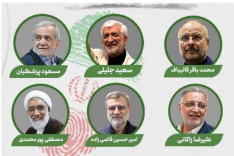
بهريزيرهكانى ههلبازردنى سهروككۆمارى ئيران له سالى ۲۰۲۴

▪ جهليلى كه يهكيكى ديكهيه له كانديه توندرههوهكان بۆ سهروكايهتتى كۆمارى ئيران، ئيديعاى زهريفى پهت كردهوه كه چاوپوشى ياخود جيبهجينهكردنى سزاكانى سهر ئيران لهلايهن بايدنهوه، بووته هوى زيادبوونى فرؤشتنى نهوتى ئيران. جهليلى له وتاريكى له بانگهشهى ههلبزاردندا له ۱۸ى حوزهيران ئەو پرسيارهى وروژاند كه ئەگهر بايدن ئاماده بوو ريگه به فرؤشتنى نهوتى ئيران بدات، بۆچى حكومهتهكهى رۇحانى نهوتى زياترى نهفرؤشت؟