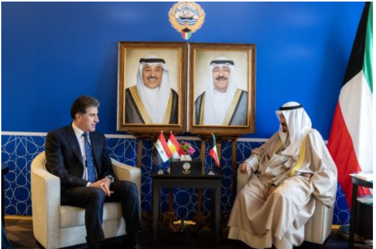
بەرېز نېچېرفان بارزانى، سەرۇكى ھەرىمى كوردستان و بەرېز شېخ ئەحمەد عەبدوللا ئەلئەحمەد

لە كاتېكدا قۇلۇدېمىر زېلېنسكى، سەرۇكى ئۇكرائنا، ئامادەبوونى خۇى لە كۇبوونەوھەكەدا ڤاگەياندى، دەنگۇى پېشكەشكردى “پلانى ئاشتى ئەمريكى” بۇ كۇتاييھېنان بە جەنگى ئۇكرائنا لە ميونشن بلاو بوووتەوھە. پېشېنېيەكان باس لەوھە دەكەن كە كېس كلۇگ، نوېنەرى تايبەتى تېرەمپ بۇ ئۇكرائنا، وردەكارىيەكانى پلانەكە لە ميونشن دەخاتە ڤوو. كرىستۇف ھويسگن، سەرۇكى كۇنفرانسى ميونشن و ڤاويژكارى پېشووى سىياسەتى دەرەوھى ئەنگېلا مېركل و نوېنەرى ھەمىشەبىي ئەلمانيا لە نەتەوھە يەكگرتووھەكان، ھىواى خواست كە كۇبوونەوھەكە دەرڤەتېك بۇ پېشكەوتنى دېپلۇماسى سەبارەت بە ئۇكرائنا بېنېتە ئاراوھ.